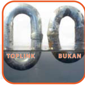
Tes Karat Hari Ke-14