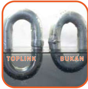
Tes Karat Hari Pertama